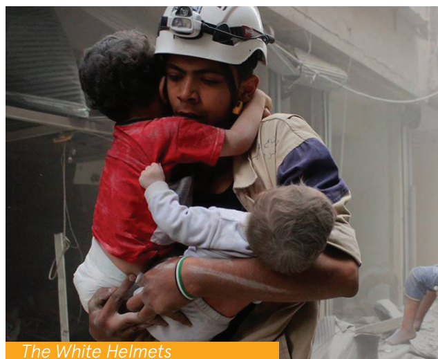
The White Helmets

The White Helmets are bakers, tailors, engineers, pharmacists, painters, carpenters, and students. When no one else would, they met a need for search and rescue workers at bombing sites with no obligation to do so. They are also part of