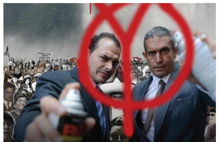
The Yes Men

Infos zum Thementag: https://elevate.at/sa2410/