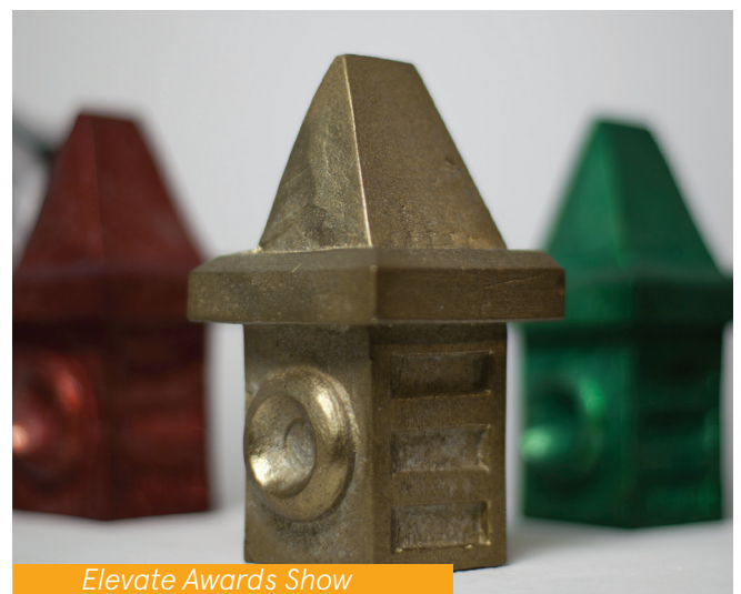
Elevate Awards Show

Infos zu den Elevate Awards und FinalistInnen: https://elevate.at/awards/information/